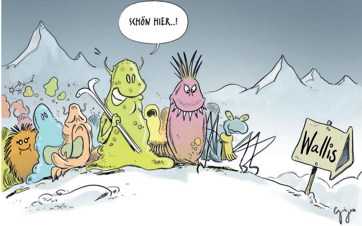
Grippewelle erfasst das Wallis.